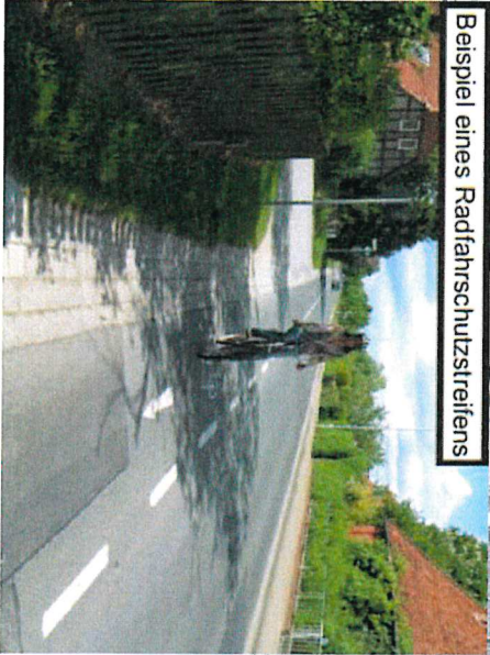
Beispiel eines Radfahrerschutzbereichs

Beginn des Radfahrerschutzbereichs am Kreisverkehr